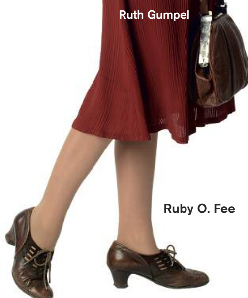
Ruby O. Fee